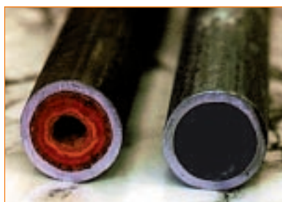
Рис. 1. Вырезки из внутридомового трубопровода горячего водоснабжения Ø33 мм до внедрения комплексной обработки воды и по истечении 6 месяцев эксплуатации в комплексном водно-химическом режиме