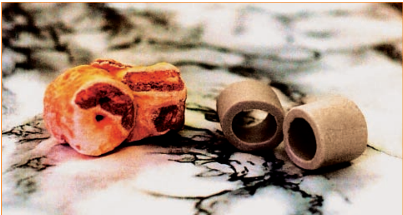
Рис. 3. Заполнитель деаэратора (кольца Рашига) до внедрения комплексонной обработки воды и по истечении 6 месяцев эксплуатации в комплексонном водно-химическом режиме